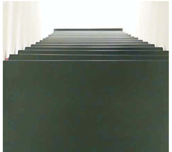
innenraum I_untersicht treppe

Die Maßstäblichkeit wirkt dem Ort entsprechend sympathisch, das Gebäude stark eigenständig und kraftvoll, dennoch zurückhaltend_gelungen!