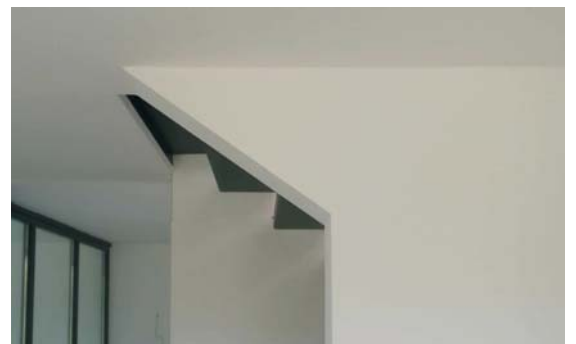
innenraum II_ blickrichtung treppenwandgalerie