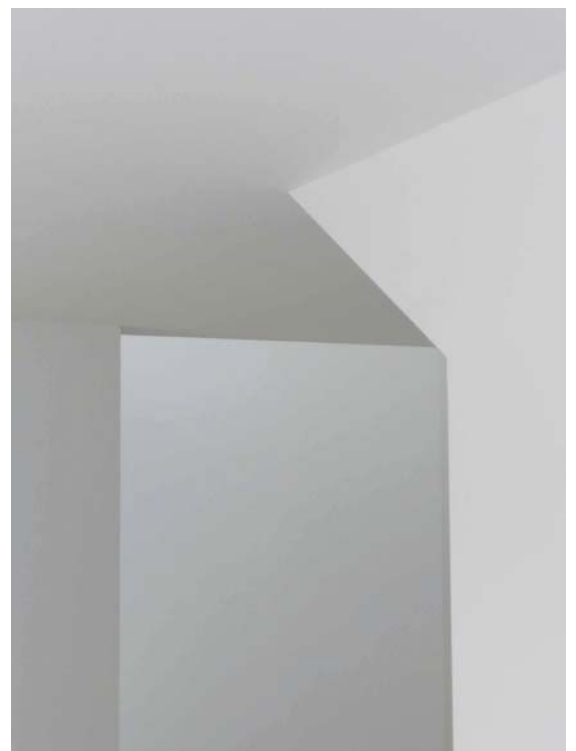
innenraum III_blickrichtung luftraum