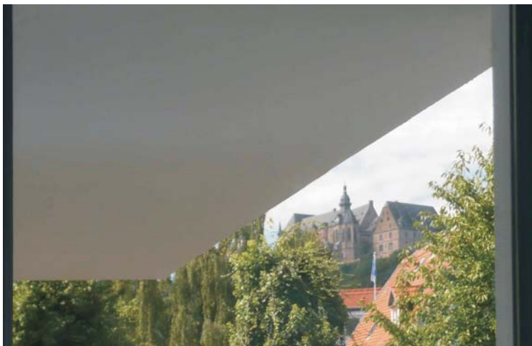
Haus M_Marburg Weidenhausen